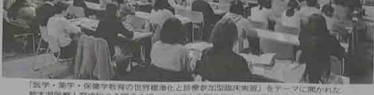
「医学・薬学・保健学教育の世界標準化と診療参加型臨床実習」をテーマに開かれた熊本県医療人育成総合会議の会場。熊本市中区東の熊本大学医学部ホールで開かれた。